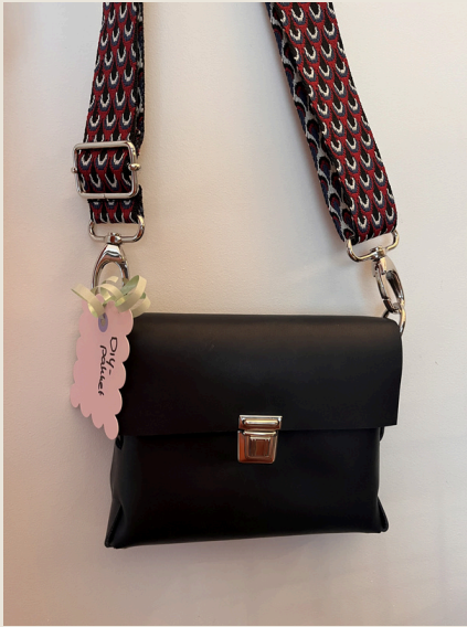
Leren handtas klein

De kosten voor het pakket is 42,50 euro incl. handleiding.